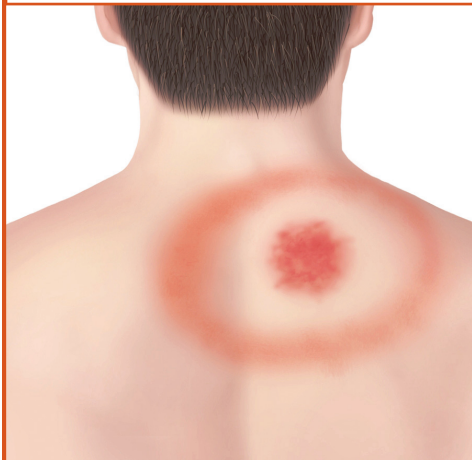
Erupción de "ojo de toro" en la espalda.